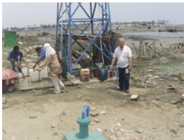
Nieuw geboorde waterput