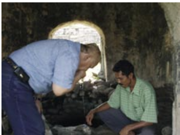
Het proeven van de waterkwaliteit uit een oude waterput nabij zee in Atjeh